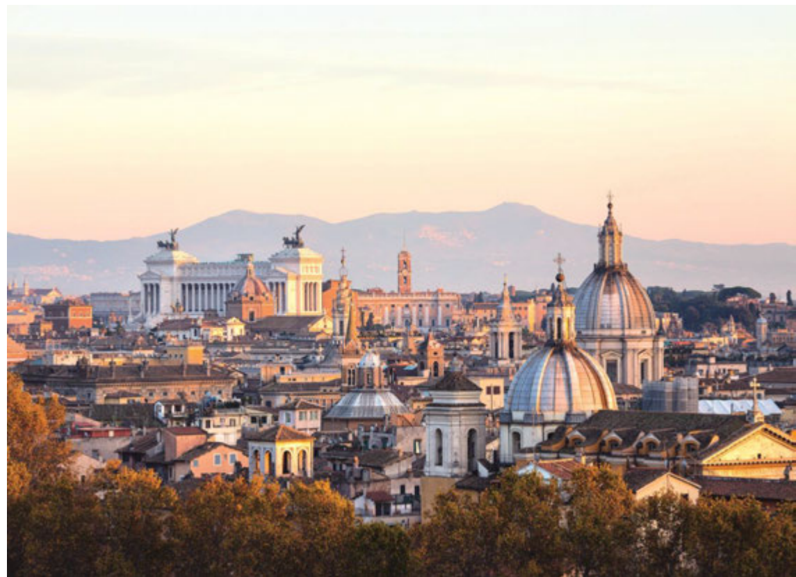
Blick über Rom